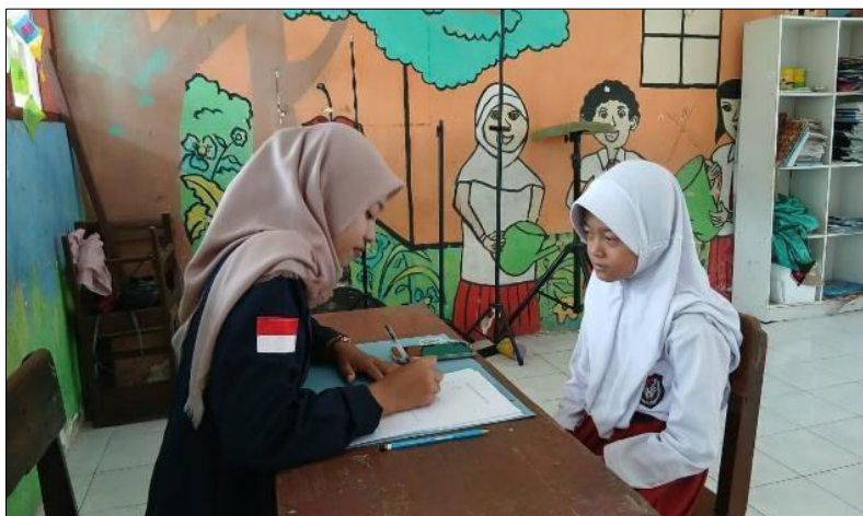
Gambar 2. Wawancara Peserta Didik.

kesalahan yang berbeda. Setelah siswa menyelesaikan tugas, guru segera memeriksa hasil tulisan untuk mengidentifikasi letak kesalahan, seperti ketidaktepatan penggunaan tanda baca, huruf kapital, maupun konjungsi yang digunakan secara berulang. Melalui cara tersebut, siswa dapat langsung memperbaiki kesalahan dan mengingatkannya sebagai bahan perbaikan pada kesempatan berikutnya.