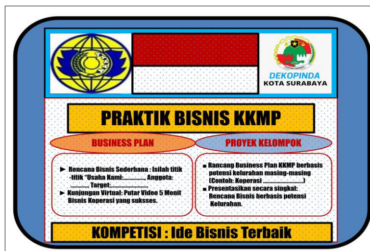
Gambar 2. Materi Pelatihan.

Salah satu KKMP yang sudah berjalan, kegiatan yang dilakukan adalah usaha sembako (beras). Pengurus koperasi bekerjasama untuk pengadaan 100 kg beras, dan telah dijual ke warga masyarakat (anggota koperasi). Meskipun keuntungan yang diperoleh tidak seberapa, namun apabila dilakukan secara berkelanjutan akan menambah pendapatan koperasi. KKMP di Kecamatan Genteng terus berupaya menambah jumlah anggota agar modal yang diperoleh juga semakin besar, sehingga dapat menggerakkan usaha koperasi. Adapun untuk menambah jumlah anggota, pengurus koperasi dapat bekerjasama dengan LMPK, KSH, PKK, dan RT/RW. Koperasi Kelurahan Merah Putih (KKMP) sebagai penggerak ekonomi kerakyatan diharapkan dapat menyerap tenaga kerja langsung di tingkat kelurahan. Peningkatan partisipasi anggota juga dapat memperkuat kemandirian koperasi dalam memenuhi kebutuhan pokok masyarakat secara lebih stabil.