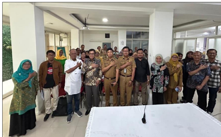
Gambar 1. Dokumentasi Kegiatan Pengabdian Masyarakat.

pengurus dan pengawas KKMP sebanyak 30 orang, dan dihadiri oleh Camat Genteng beserta jajarannya serta Ketua Dekopinda Kota Surabaya sebagaimana yang dapat dilihat pada Gambar 1.