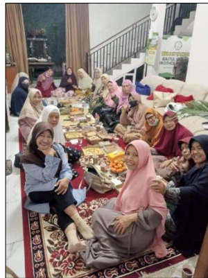
Gambar 5. Kegiatan Buka Puasa Bersama sebagai Tindak Lanjut dari Program Berbagi Takjil Ramadhan.

Sebagaimana dinyatakan oleh Mairizal et al. (2024), kegiatan berbagi takjil tidak hanya bernilai ibadah secara spiritual, tetapi juga berperan dalam memperlancar ukhuwah Islamiyah serta menumbuhkan kesadaran sosial di kalangan mahasiswa, yang diharapkan dapat menjadi teladan bagi generasi berikutnya. Dengan demikian, kegiatan berbagi takjil selama bulan Ramadan memiliki dimensi multidimensional, yakni spiritual, sosial, dan edukatif, yang secara kolektif berkontribusi terhadap penguatan solidaritas sosial dan pembentukan karakter kepedulian di kalangan generasi muda.