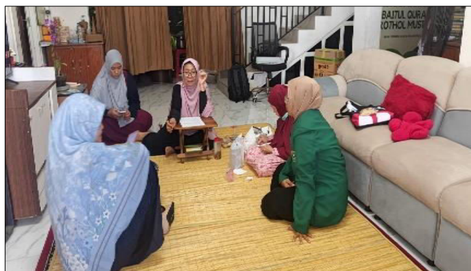
Gambar 3. Rapat Sebelum Terselenggaranya Acara.

Gambar 2 menunjukkan bahwa perkumpulan tersebut sedang mengikuti kegiatan tausiyah. Tausiyah merupakan bentuk nasihat atau ceramah keagamaan dalam Islam yang berisi ajakan untuk berbuat kebaikan serta meningkatkan keimanan dan ketakwaan kepada Allah SWT. Kegiatan ini umumnya disampaikan oleh ustaz/ustazah atau para ulama yang berkompeten di bidang keagamaan. Materi tausiyah biasanya bersumber dari ajaran Al-Qur'an dan Hadis, sehingga dapat memberikan pemahaman keagamaan yang lebih mendalam kepada masyarakat. Melalui kegiatan ini, peserta dapat meningkatkan kualitas keimanan dan ketakwaan, serta terdorong untuk memperbaiki perilaku dalam kehidupan sehari-hari sesuai dengan nilai-nilai Islam. Tausiyah juga memiliki fungsi sosial, yaitu memperlancar hubungan dan memperkuat ukhuwah Islamiyah antarumat Muslim, terutama karena pelaksanaannya sering dilakukan dalam bentuk kegiatan bersama seperti pengajian atau majelis taklim (Yusuf et al. , 2023). Dengan demikian, tausiyah memiliki peran yang penting dalam kehidupan umat Islam, baik sebagai sarana peningkatan pengetahuan agama, penguatan ukhuwah Islamiyah, maupun sebagai motivasi untuk senantiasa melakukan perbaikan diri berdasarkan tuntunan Al-Qur'an dan Hadis.