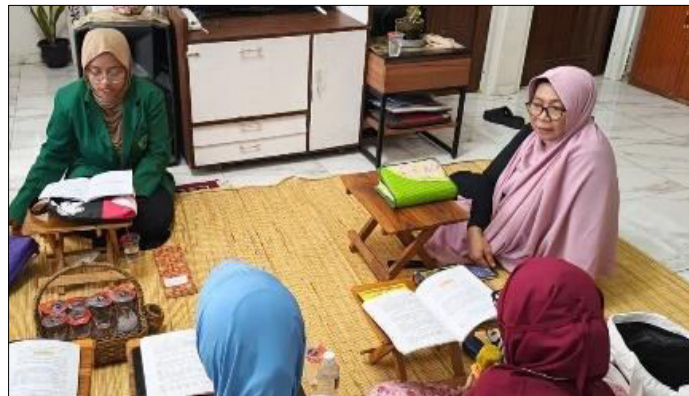
Gambar 1. Kegiatan Pembacaan Dzikir Pagi Sebelum Dimulainya Musyawarah.

toleransi, dan kerja sama dalam kehidupan sehari-hari (Faelasup & Handayani, 2025). Oleh karena itu, pembiasaan sikap peduli, saling membantu, dan menghargai perbedaan diyakini dapat memperkuat solidaritas sosial, meningkatkan dukungan antaranggota masyarakat, serta mendorong kemampuan masyarakat dalam menghadapi berbagai tantangan secara kolektif. Dengan demikian, kepedulian sosial tidak hanya dipahami sebagai sebuah konsep, tetapi juga sebagai fondasi utama dalam menciptakan lingkungan masyarakat yang damai, inklusif, dan berdaya.