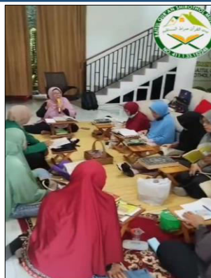
Gambar 2. Setelah Berdzikir dan Berdoa, Dilanjutkan dengan Tausiyah.

Gambar 2 menunjukkan bahwa perkumpulan tersebut sedang mengikuti kegiatan tausiyah. Tausiyah merupakan bentuk nasihat atau ceramah keagamaan dalam Islam yang berisi ajakan untuk berbuat kebaikan serta meningkatkan keimanan dan ketakwaan kepada Allah SWT. Kegiatan ini umumnya disampaikan oleh ustaz/ustazah atau para ulama yang berkompeten di bidang keagamaan. Materi tausiyah biasanya bersumber dari ajaran Al-Qur'an dan Hadis, sehingga dapat memberikan pemahaman keagamaan yang lebih mendalam kepada masyarakat. Melalui kegiatan ini, peserta dapat meningkatkan kualitas keimanan dan ketakwaan, serta terdorong untuk memperbaiki perilaku dalam kehidupan sehari-hari sesuai dengan nilai-nilai Islam. Tausiyah juga memiliki fungsi sosial, yaitu memperlancar hubungan dan memperkuat ukhuwah Islamiyah antarumat Muslim, terutama karena pelaksanaannya sering dilakukan dalam bentuk kegiatan bersama seperti pengajian atau majelis taklim (Yusuf et al. , 2023). Dengan demikian, tausiyah memiliki peran yang penting dalam kehidupan umat Islam, baik sebagai sarana peningkatan pengetahuan agama, penguatan ukhuwah Islamiyah, maupun sebagai motivasi untuk senantiasa melakukan perbaikan diri berdasarkan tuntunan Al-Qur'an dan Hadis.