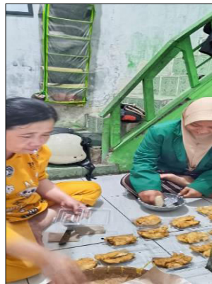
Gambar 4. Kegiatan Penyiapan Hidangan Takjil untuk Masjid.

Rapat persiapan merupakan bagian penting dalam manajemen acara ( event management ) yang bertujuan memastikan seluruh elemen kegiatan dapat terkoordinasi dengan baik serta terjalinnya komunikasi yang efektif sebelum pelaksanaan acara. Dalam mencapai tujuan bersama, diperlukan saling pengenalan antaranggota tim, karena hal ini berperan penting dalam mendukung efektivitas kerja dan optimalisasi hasil yang dicapai. Kelancaran proses komunikasi dapat terwujud melalui kerja sama tim yang solid (Wijaya, 2024). Oleh karena itu, rapat koordinasi panitia menjadi fondasi utama dalam penyelenggaraan suatu acara. Selain konteks kepanitiaan, pengajian juga merupakan aktivitas pembelajaran keislaman yang dilaksanakan secara berkelompok dan dipandu oleh tokoh atau ahli agama dengan menggunakan metode tertentu. Pengajian berfungsi sebagai sarana pendalaman ilmu keagamaan serta menjadi wadah untuk mempererat silaturahmi antarpeserta.