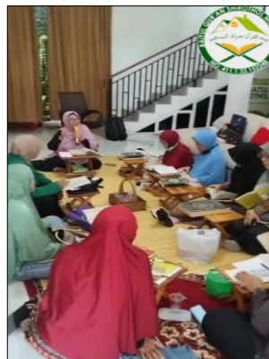
Gambar 7. Rapat Koordinasi Akhir Kepanitiaian dalam Rangka Persiapan Penyelenggaraan Acara Nuzulul Qur'an.

Sebelum suatu acara dilaksanakan, diperlukan data mengenai pihak-pihak yang akan diundang. Gambar 6 menunjukkan aktivitas pencatatan dan pengolahan administrasi yang merupakan bagian integral dari manajemen kegiatan. Administrasi yang tertib dan rapi menjadi fondasi penting dalam keberhasilan pelaksanaan suatu acara. Kegiatan pencatatan dan dokumentasi data kepanitiaian merupakan wujud nyata penerapan fungsi manajemen, khususnya dalam aspek pengorganisasian dan pengendalian. Dalam hal ini, fungsi administrasi mencakup perencanaan, pengorganisasian, pelaksanaan, serta pengawasan yang harus didokumentasikan secara sistematis dan komprehensif. Dalam konteks kepanitiaian, pencatatan yang terstruktur berperan penting dalam meminimalkan risiko miskomunikasi antaranggota tim serta memastikan koordinasi kerja berjalan secara efektif dan efisien. Dengan demikian, sistem administrasi yang baik berkontribusi signifikan terhadap kelancaran dan keberhasilan suatu kegiatan.