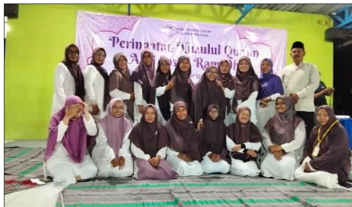
Gambar 8. Pelaksanaan Puncak Acara Peringatan Nuzulul Qur'an sebagai Hasil dari Serangkaian Persiapan Kepanitiaan.

setempat. Dalam upaya mencapai tujuan bersama, pengenalan antaranggota menjadi aspek krusial yang perlu diperhatikan guna menunjang optimalisasi kinerja serta kelancaran alur komunikasi dalam kerja sama tim. Proses ini menunjukkan bahwa rapat koordinasi yang terstruktur dan terlaksana dengan baik merupakan fondasi utama keberhasilan penyelenggaraan suatu kegiatan (Raffy et al. , 2025). Oleh karena itu, kegiatan tausiyah memiliki urgensi untuk dilestarikan dan dikembangkan dalam kehidupan masyarakat Muslim sebagai sarana pembinaan nilai-nilai keagamaan dan penguatan spiritual.