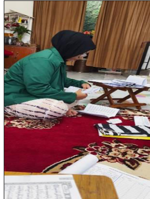
Gambar 6. Pelaksanaan Administrasi Kepanitiaian dalam Penyelenggaraan Kegiatan Peringatan Nuzulul Qur'an.

Sebelum suatu acara dilaksanakan, diperlukan data mengenai pihak-pihak yang akan diundang. Gambar 6 menunjukkan aktivitas pencatatan dan pengolahan administrasi yang merupakan bagian integral dari manajemen kegiatan. Administrasi yang tertib dan rapi menjadi fondasi penting dalam keberhasilan pelaksanaan suatu acara. Kegiatan pencatatan dan dokumentasi data kepanitiaian merupakan wujud nyata penerapan fungsi manajemen, khususnya dalam aspek pengorganisasian dan pengendalian. Dalam hal ini, fungsi administrasi mencakup perencanaan, pengorganisasian, pelaksanaan, serta pengawasan yang harus didokumentasikan secara sistematis dan komprehensif. Dalam konteks kepanitiaian, pencatatan yang terstruktur berperan penting dalam meminimalkan risiko miskomunikasi antaranggota tim serta memastikan koordinasi kerja berjalan secara efektif dan efisien. Dengan demikian, sistem administrasi yang baik berkontribusi signifikan terhadap kelancaran dan keberhasilan suatu kegiatan.