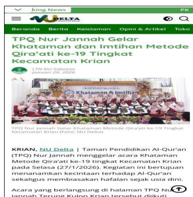
Gambar 5. Hasil Karya Berita Peserta yang Berhasil Publish.

Pada gambar tersebut terlihat fasilitator sedang mendampingi peserta dalam menelaah hasil tulisan berita yang telah mereka susun. Tahapan ini merupakan proses penilaian, di mana setiap peserta menerima masukan mengenai susunan teks, ketepatan bahasa, kelengkapan unsur berita, serta validitas informasi yang disampaikan. Pendampingan diberikan secara langsung dan dialogis agar peserta dapat memahami dengan jelas bagian yang sudah tepat maupun bagian yang masih perlu diperbaiki. Menurut Rizal et al. (2021), sesi ini juga dimanfaatkan sebagai ruang diskusi dan tanya jawab sehingga peserta dapat merevisi tulisannya berdasarkan arahan yang diberikan. Melalui proses evaluasi semacam ini, peserta tidak hanya memperbaiki kualitas tulisan, tetapi juga dilatih untuk lebih cermat, kritis, dan percaya diri dalam menghasilkan karya jurnalistik yang baik.