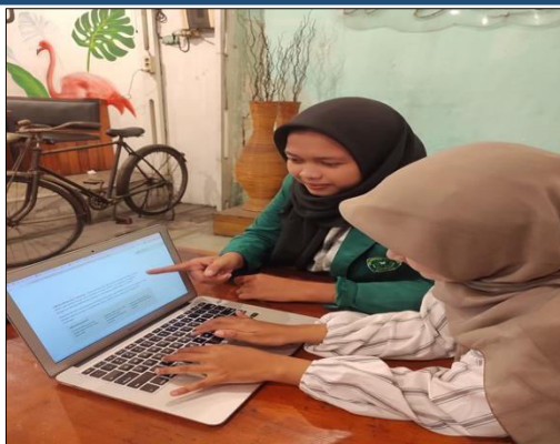
Gambar 4. Mengevaluasi Tugas Berita Peserta.

Pada gambar tersebut terlihat fasilitator sedang mendampingi peserta dalam menelaah hasil tulisan berita yang telah mereka susun. Tahapan ini merupakan proses penilaian, di mana setiap peserta menerima masukan mengenai susunan teks, ketepatan bahasa, kelengkapan unsur berita, serta validitas informasi yang disampaikan. Pendampingan diberikan secara langsung dan dialogis agar peserta dapat memahami dengan jelas bagian yang sudah tepat maupun bagian yang masih perlu diperbaiki. Menurut Rizal et al. (2021), sesi ini juga dimanfaatkan sebagai ruang diskusi dan tanya jawab sehingga peserta dapat merevisi tulisannya berdasarkan arahan yang diberikan. Melalui proses evaluasi semacam ini, peserta tidak hanya memperbaiki kualitas tulisan, tetapi juga dilatih untuk lebih cermat, kritis, dan percaya diri dalam menghasilkan karya jurnalistik yang baik.