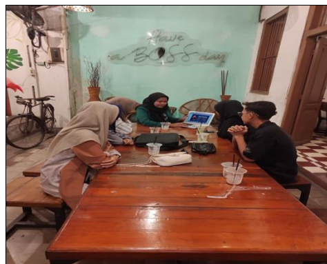
Gambar 2. Proses Penjelasan Materi.

Dalam gambar ini, seorang fasilitator menggunakan laptop dengan proyektor sebagai alat penyampaian untuk mempersiapkan materi presentasi untuk sesi pelatihan jurnalistik. Langkah ini adalah yang pertama dalam rangkaian latihan pendidikan yang dirancang untuk memastikan bahwa semua alat, materi presentasi, dan contoh materi berita siap digunakan sebelum sesi dimulai. Agar presentasi berjalan lancar dan mudah dipahami oleh audiens, persiapan ini meliputi peninjauan file presentasi, modifikasi tampilan visual, dan pengaturan urutan informasi (Fitri et al. , 2024). Prosedur ini penting untuk memastikan kegiatan berjalan dengan baik, mengurangi kesulitan teknologi, dan memberikan peserta pelatihan lingkungan belajar yang terkontrol, produktif, dan nyaman.