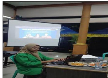
Gambar 1. Mempersiapkan Materi.

bersifat kolaboratif dan partisipatif, sehingga mampu mendorong terciptanya komunikasi yang efektif, kerja sama, serta rasa kebersamaan yang mempererat solidaritas di lingkungan desa. Selain itu, kegiatan ini juga berkontribusi dalam meningkatkan kesadaran pelajar terhadap berbagai isu sosial, pendidikan, dan lingkungan di sekitarnya, serta menumbuhkan kepekaan dalam memahami kondisi masyarakat. Melalui keterampilan jurnalistik, pelajar didorong untuk menyampaikan informasi yang edukatif, objektif, dan konstruktif sebagai bentuk kontribusi positif (Priyandoko, 2023). Di sisi lain, program ini juga memberikan pengalaman langsung bagi pelaksana dalam memahami dinamika sosial di wilayah pedesaan sekaligus menerapkan pengetahuan akademik dalam praktik. Menurut Zunaidi (2024), keterlibatan tersebut tidak hanya meningkatkan kompetensi profesional, tetapi juga mengembangkan kepekaan sosial serta kemampuan beradaptasi dengan kebutuhan masyarakat, sehingga proses pembelajaran menjadi lebih kontekstual dan bermakna.