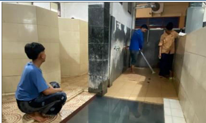
Gambar 6. Kegiatan Membersihkan Kamar Mandi dan Tempat Wudhu yang Dilakukan oleh Santri.

Tahap pelaksanaan pada gambar tersebut menunjukkan kegiatan membersihkan kamar mandi dan tempat wudhu yang dilakukan oleh para santri secara bersama-sama. Kegiatan ini meliputi menyikat lantai, dinding, serta area sekitar kran air untuk menghilangkan kotoran, lumut, dan noda yang menempel agar tidak licin dan tetap higienis. Selain itu, santri juga membersihkan saluran pembuangan air serta memastikan tidak ada sampah yang menyumbat, sehingga air dapat mengalir dengan lancar. Area tempat wudhu sebagai fasilitas penting untuk beribadah mendapatkan perhatian khusus agar tetap bersih, suci, dan nyaman digunakan. Dalam pelaksanaannya, santri menggunakan alat kebersihan seperti sikat, sabun pembersih, dan air, serta membagi tugas agar pekerjaan lebih efektif. Kegiatan ini tidak hanya menciptakan lingkungan yang sehat dan nyaman, tetapi juga menanamkan nilai kedisiplinan dan tanggung jawab dalam menjaga kebersihan fasilitas bersama.