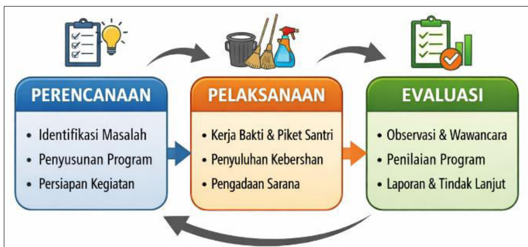
Gambar 1. Alur Pelaksanaan Program Kebersihan Lingkungan Pondok Pesantren.

Adapun alur kegiatan pengabdian dapat digambarkan sebagai berikut: