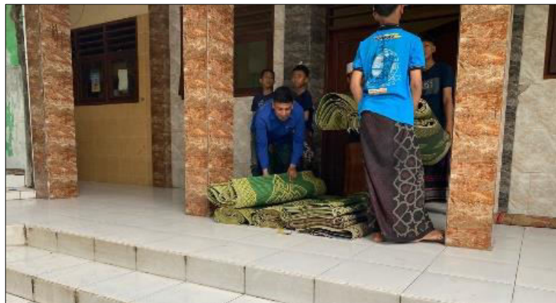
Gambar 3. Kegiatan Menata Tikar Gulung yang Dilakukan oleh Santri.

menggunakan paving block, mengumpulkan sampah, serta membersihkan area sekitar gapura atau pintu masuk pondok. Kegiatan ini dilakukan secara gotong royong dengan pembagian tugas yang jelas, di mana ada yang fokus menyapu, mengumpulkan kotoran, dan merapikan area sekitar. Latar depan pondok sebagai area pertama yang dilihat oleh tamu maupun penghuni menjadi prioritas utama dalam menjaga kebersihan dan kerapian. Melalui kegiatan ini, tidak hanya tercipta lingkungan yang bersih dan nyaman, tetapi juga menumbuhkan rasa tanggung jawab dan kepedulian santri terhadap kebersihan lingkungan pondok secara berkelanjutan.