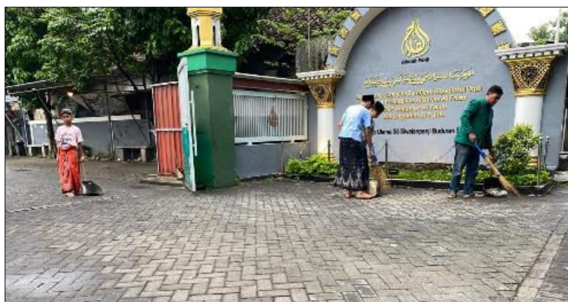
Gambar 2. Membersihkan Latar Depan Pondok yang Dilakukan oleh Santri.

Tahap pelaksanaan melakukan kerja bakti dan piket santri yang sudah di jadwalkan oleh para pengurus. Berikut beberapa gambar dan penjelasannya.