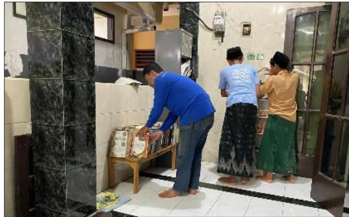
Gambar 5. Kegiatan Merapikan Kitab yang Dilakukan oleh Para Santri.

Tahap pelaksanaan pada gambar tersebut menunjukkan kegiatan membersihkan saluran air yang dilakukan oleh para santri dengan cara mengangkat penutup saluran (grill) dan membersihkan kotoran yang menumpuk di dalamnya. Terlihat santri menggunakan alat seperti sekop dan tangan secara langsung untuk mengeruk lumpur, sampah, serta endapan yang dapat menghambat aliran air. Kegiatan ini dilakukan secara teliti sepanjang saluran agar tidak ada sumbatan yang tersisa, sehingga aliran air dapat kembali lancar dan mencegah terjadinya genangan maupun bau tidak sedap di lingkungan pondok. Selain itu, pembersihan saluran air juga berperan penting dalam menjaga kesehatan lingkungan dengan mengurangi potensi berkembangnya penyakit. Melalui kegiatan ini, santri tidak hanya menjaga kebersihan, tetapi juga belajar pentingnya perawatan fasilitas lingkungan secara rutin dan bertanggung jawab.