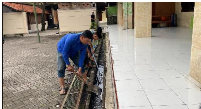
Gambar 4. Kegiatan Membersihkan Saluran Air yang Dilakukan oleh Para Santri.

Tahap pelaksanaan pada gambar tersebut menunjukkan kegiatan menata tikar gulung yang dilakukan oleh santri dengan cara menyusun tikar secara rapi dan teratur di area teras atau ruang bersama pondok. Terlihat beberapa santri menggulung tikar dengan ukuran yang seragam, kemudian menumpuknya secara sejajar agar mudah disimpan dan digunakan kembali saat diperlukan, seperti untuk kegiatan mengaji atau istirahat. Penataan ini dilakukan dengan memperhatikan kerapian dan efisiensi ruang, sehingga lingkungan terlihat lebih tertib dan tidak berantakan. Selain itu, kegiatan ini juga bertujuan menjaga kebersihan tikar dari debu dan kotoran serta memperpanjang masa pakainya. Melalui aktivitas ini, santri dilatih untuk memiliki sikap disiplin, tanggung jawab, serta kepedulian terhadap fasilitas pondok.