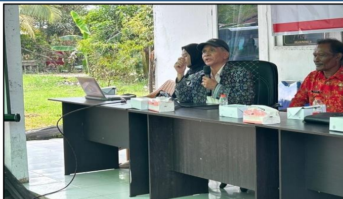
Gambar 4. Tim Pengusul PkM Fakultas Hukum Universitas Tanjungpura Memberikan Penyuluhan/Sosialisasi.