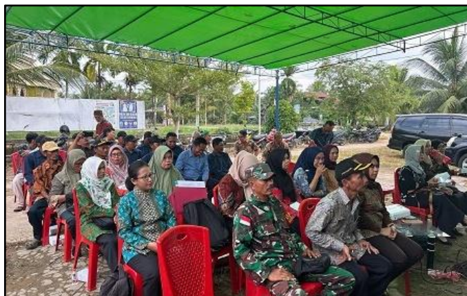
Gambar 5. Peserta PkM di Desa Parit Keladi.