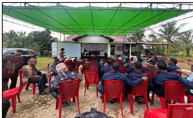
Gambar 3. Lokasi Kegiatan PkM di Desa Parit Keladi.