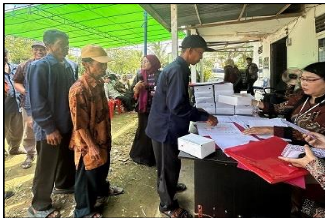
Gambar 2. Proses Registrasi Pelaksanaan PkM oleh Fakultas Hukum di Desa Parit Keladi.

Kegiatan PkM ini berlangsung selama 5 bulan dengan 3 tahap utama, yaitu tahap koordinasi dengan mitra, tahap pelaksanaan dan monitoring, serta evaluasi hasil kegiatan PkM. Pada tahap koordinasi diharapkan menyiapkan perencanaan dengan matang, tahap pelaksanaan dilaksanakan pada tanggal 7 Agustus 2025, pada tahapan ini dilakukan dengan transfer ilmu pengetahuan dan keterampilan berupa penyusunan peraturan desa tentang rencana pembangunan jangka menengah desa mitra, yaitu Desa Parit Keladi yang hadir terdiri atas Pemerintah Desa Parit Keladi dan Masyarakat Desa Parit Keladi. Kegiatan berlangsung dengan kondusif, dinamis dan sinergis. Setiap pertemuan yang dilakukan antara Tim Pengusul PkM dan Mitra Masyarakat Desa Parit Keladi diperoleh peningkatan hasil program sesuai yang diharapkan dalam kegiatan PkM ini. Tim Pengusul PkM, Fakultas Hukum, Universitas Tanjungpura, secara periodik tetap melakukan koordinasi dengan masyarakat dan Pemerintah Desa Parit Keladi untuk melakukan monitoring dan evaluasi untuk keberlanjutan pengabdian masyarakat ini. Berikut beberapa dokumentasi kegiatan: