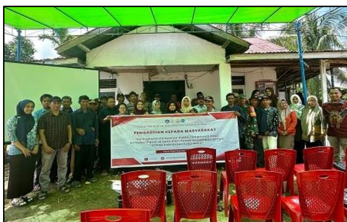
Gambar 6. Foto Bersama.

Pelaksanaan Pengabdian kepada Masyarakat (PkM) di Desa Parit Keladi berfokus pada penguatan kapasitas aparaturnya dalam memanfaatkan teknologi digital sebagai instrumen peningkatan kualitas pelayanan publik. Berdasarkan hasil analisis situasi, ditemukan bahwa layanan publik di desa ini belum sepenuhnya mengoptimalkan media digital, baik melalui website resmi maupun media sosial. Website desa yang tersedia belum dikelola secara maksimal, sementara akun media