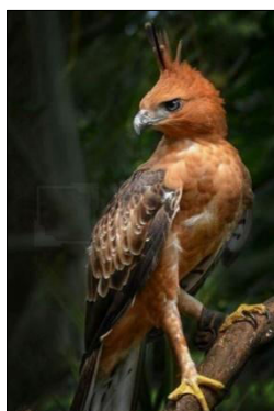
Gambar 2. Sumber Ide Elang Jawa.

Penilaian kualitas karya dilakukan melalui proses validasi oleh tiga orang ahli yang memiliki kompetensi dalam bidang seni rupa dan tata rias berdasarkan tampilan dalam Gambar 2, 3, dan 4.