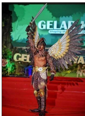
Gambar 3. Tampilan Keseluruhan Karya Body Painting Fantasi Berbasis Mixed Media .