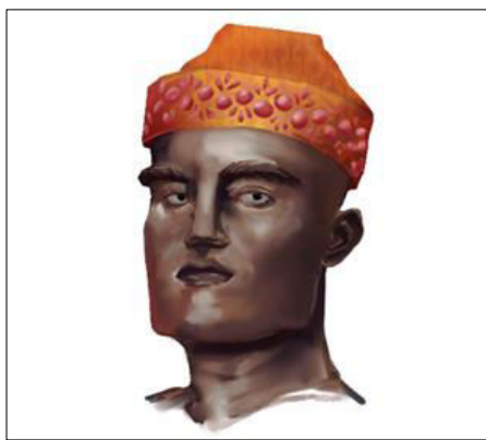
Gambar 2. Desain Makeup Wajah.

Pada tahap pengembangan, desain final rias wajahnya dibuat dengan SFX makeup dengan menambahkan prostetik untuk wajah karakter Si Gale-Gale yang menekankan ketegasan struktur wajah patung seperti bentuk rahang, alis, dan hidung. Disiapkan juga pola body painting dengan motif Gorga Batak yang diaplikasikan mulai dari bagian dada, lengan, hingga kaki, sesuai rancangan moodboard yang telah dirancang sebelumnya. Tahap ini menghasilkan berupa desain makeup wajah dan body painting . Desain makeup wajah dan body painting disajikan dalam Gambar 2 dan 3.