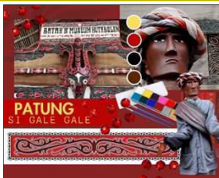
Gambar 1. Moodboard.