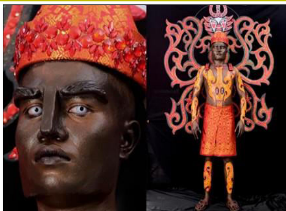
Gambar 4. Hasil Karya Adaptasi Patung Si Gale-Gale.

Setelah pembuatan karya selesai, penilaian karya dilakukan oleh tiga validator ahli kecantikan menggunakan lembar validasi yang telah disusun berdasarkan indikator penilaian. Hasil penilaian tersebut kemudian dianalisis untuk menentukan tingkat kelayakan dan kualitas karya secara keseluruhan. Hasil penilaian dari ketiga validator ahli disajikan pada Tabel 2.