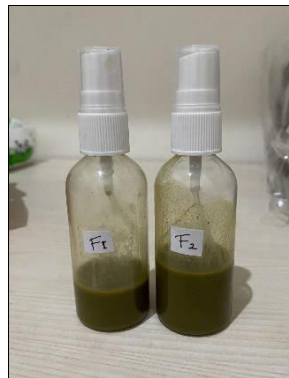
Gambar 1. Face Mist Daun Pepaya.

Dari penelitian yang telah dilakukan, uji dilakukan tiga kali replikasi untuk setiap formula, menggunakan vitamin C sebagai pembanding (deret baku). Absorbansi diukur pada panjang gelombang 517 nm. Persentase peredaman dihitung dengan rumus: